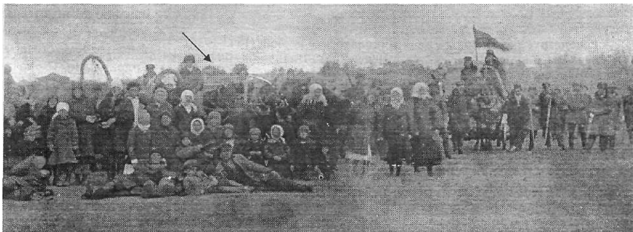
Вид с левого берега реки Иня. На правобережье—современная ул. Красная и контур церкви. 01.05.1931 г.

Из всех существовавших церковных зданий в селе остался лишь дом бывших церковнослужителей. Дом построен в конце XIX века из красного леса. Сохранились глухие ставни без декоративного оформления, внутренняя планировка. Территория современного сельского