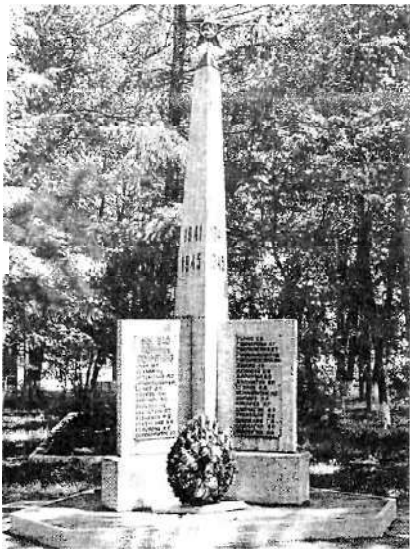
Памятник рабочим депо, 2004 год

10 ноября 1976 года - Указом Президиума Верховного Совета