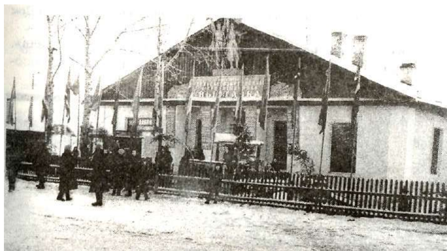
Выставочный зал сельскохозяйственной и промышленной продукции (1958-1960), библиотека (1960-1978), музей (1980-2003) Здание снесено в 2004 году.

7 февраля 1980 года - из совхоза «Хорошеборский» выделен самостоятельный совхоз «Опаринский».