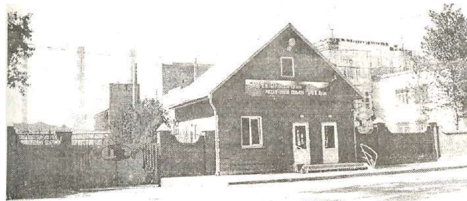
ООО «Топкинский цементный завод», 2004 год.

30 января 1966 года пушена первая очередь Топкинского цементного завода.