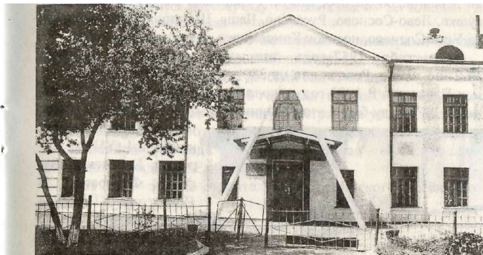
Здание школа № 9, 2004 год.