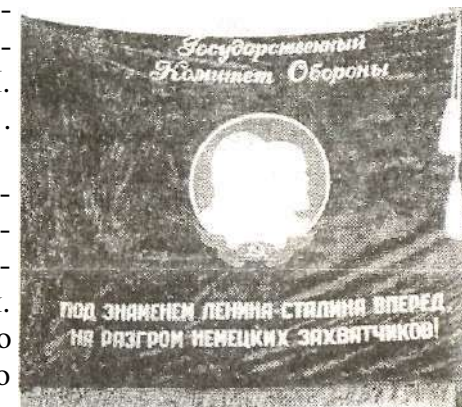
Красное знамя Государственного Комитета обороны

В 1955 году с территории железнодорожного вокзала скульптуру В. И. Ленина перенесли к школе № 7, скульптуру И. В. Сталина установили в парке возле клуба железнодорожников. Позднее там же была установлена скульптура М. Горького.