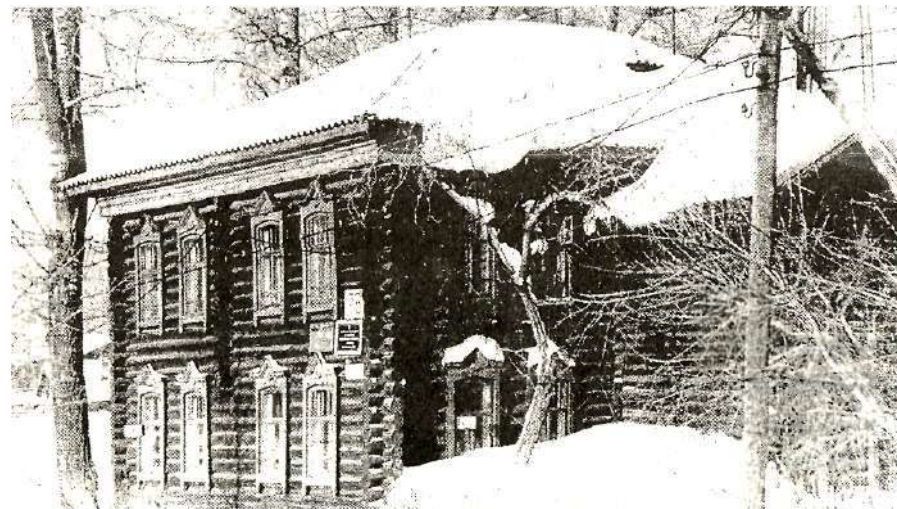
Здание Дома пионеров по улице Советской, 1970-е годы

11 февраля 1958 года - Дом пионеров переезжает в 2-х этажное деревянное здание по улице Комсомольской. (Бывшее здание горсовета. В настоящее время этого здания нет, на этом месте построено здание Кузбасспромбанка. Ныне его занимает Налоговая инспекция).