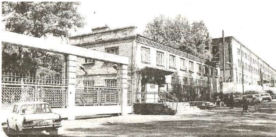
ЗАО «Сибтензоприбор», 2004 год

20 ноября 1992 года - на основании решения № 113 Топкинского горсовета предприятие Топкинский механический завод зарегистрирован как АЗОТ «Сибтензоприбор».