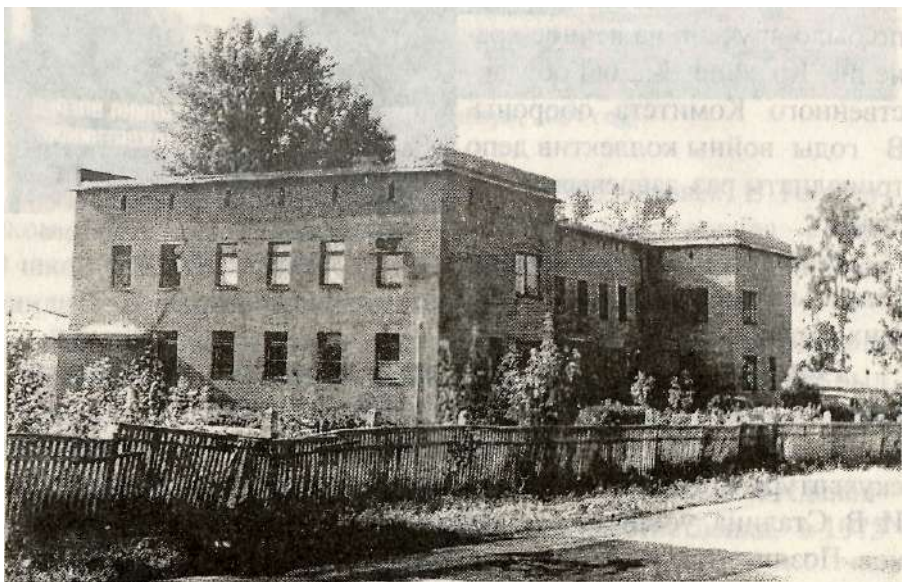
Ул.Революции, поликлиника, 1988 год.